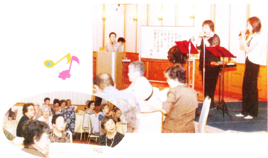
趣向を凝らしたアトラクション・カラオケ

【日時】平成二十年八月四日 (月) 今年より福引が恒例となり大好評 回を重ねることに大盛況。 来る十一月二十日(木) ルブラ王山にて乞うご期待。