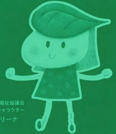
千種区社会福祉協議会 マスコットキャラクター ユーカリーナ

千種区社会福祉協議会では、区民の皆様とともに地域福祉を推進するにあたり、地域での福祉事業を支援するため、会員としてその経費にご協力いただく賛助会員を広く募集いたします。