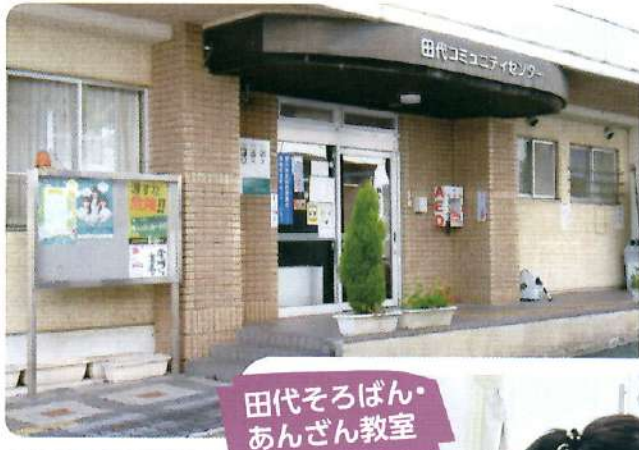
田代そろばん・ あんざん教室