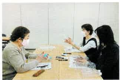
▲ペットボトルをカッターで切り、制作中