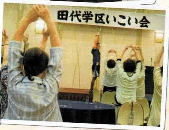
田代学区いこい会