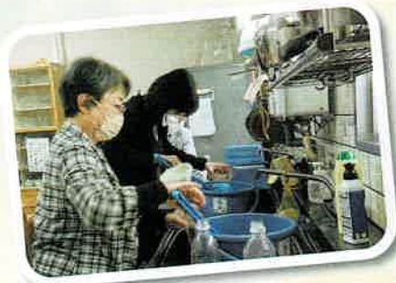
▲誘発液を、ペットボトルに注入