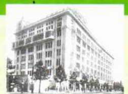
松坂屋(名古屋大津町) 増築改装及び第二期工事完成(昭和11年)