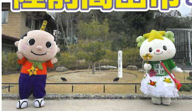
「奇跡の一本松」後継樹（東山動植物園）