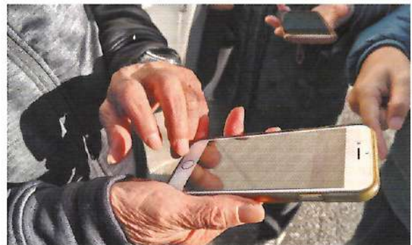
防災アプリを活用した訓練