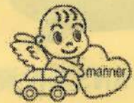
マスコットキャラクター マナーちゃん

◎12月は帰省や買い物などで車を利用する機会が多くなります。無理な割り込みや急な車線変更を避け、他の車に道を譲るなど思いやり運転を心がけましょう。