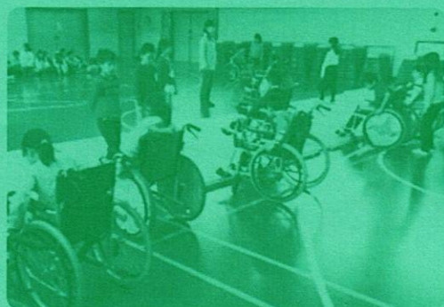
▲小中学校などで行う福祉教育