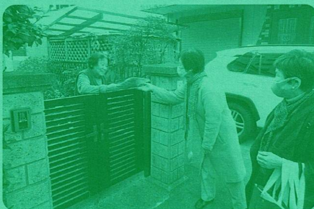
訪問などとおし、安否確認を行う見守り活動▲

学生からのメッセージとともに各種福祉情報誌などを郵送。困り事などがあれば、返信用一筆箋に記入いただき、対応していきます。