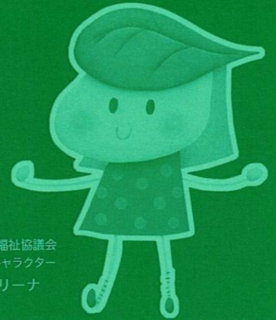
千種区社会福祉協議会 マスコットキャラクター ユーカリーナ

千種区社会福祉協議会では、区民の皆様とともに地域福祉を推進するにあたり、地域での福祉事業を支援するため、会員としてその経費にご協力いただく賛助会員を広く募集いたします。