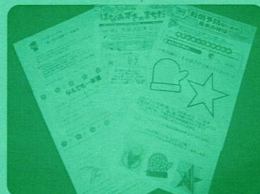
お便りなどとおし、高齢の方や障がいのある方を見守る活動▲

学生からのメッセージとともに各種福祉情報誌などを郵送。困り事などがあれば、返信用一筆箋に記入いただき、対応していきます。