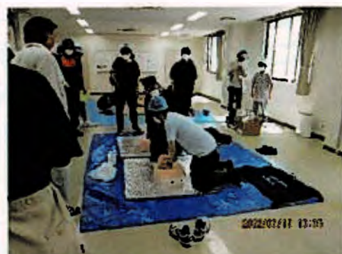
自主防災訓練での訓練指導の様子

もしも地域に大規模な災害が発生した際には消防署・消防団だけでなく地域住民の防災力が重要となります。千石消防団では地域防災力の向上のために一緒に活動してくれる消防団員を募集しています。興味のある方は、気軽に千石消防団員もしくは千種消防署までお問合せください。