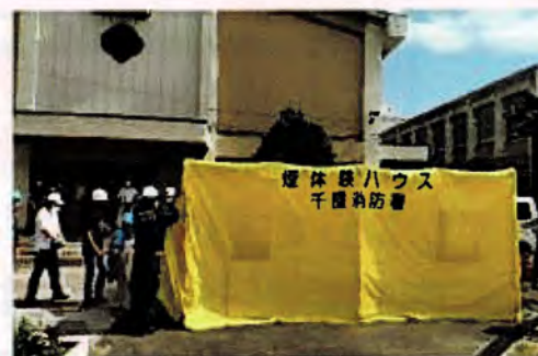
千石学区防災訓練での訓練支援の様子